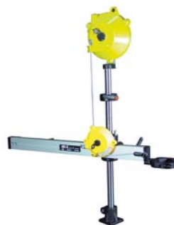
easy-linearfix-B mit Anschlägen