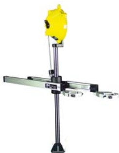
easy-linearfix-Twin für 2 Schrauber