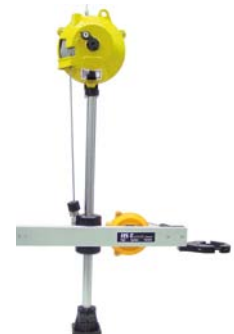
easy-linearfix-Tele Dreiachsiger Entlastungsarm